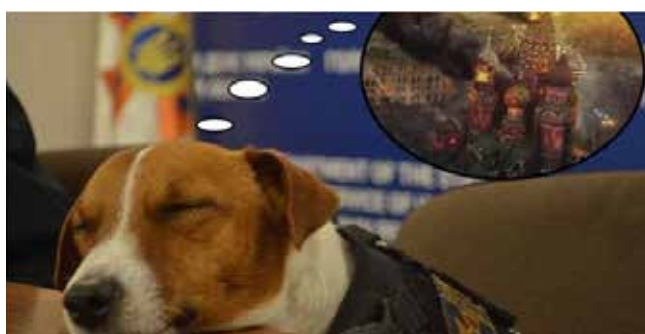
Рис. 4–5. «Патрон відпочиває»