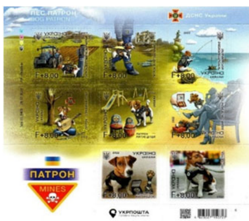
Рис. 8. Марка «Пес Патрон»

Випущена 1 вересня 2022 року марка «Пес Патрон» (рис. 8) стала першою благодійною маркою України, завдяки чому вдалося заробити понад 16 млн гривень, про що було зазначено на офіційному сайті Укрпошти (Укрпошта. 6.01.2023).