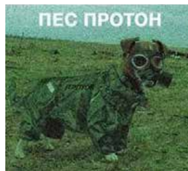
Рис. 1–3. Мемі «Пес Патрон»