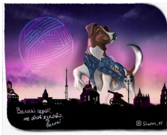
Рис. 7. «Великі герої»

бних символів війни є важливим у цей час, бо це хоч і незначні, але добрі новини для підняття патріотичного духу населення» (Суспільне. 6.06.2022).