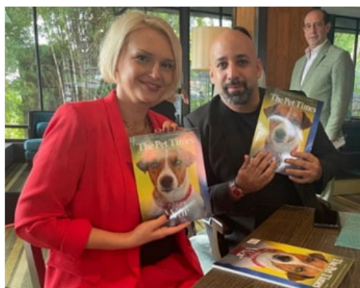
Рис. 9–10. Патрон на шпальтах «The Pet Times»