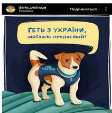
Рис. 6. «Геть з України, москаль некрасивий»